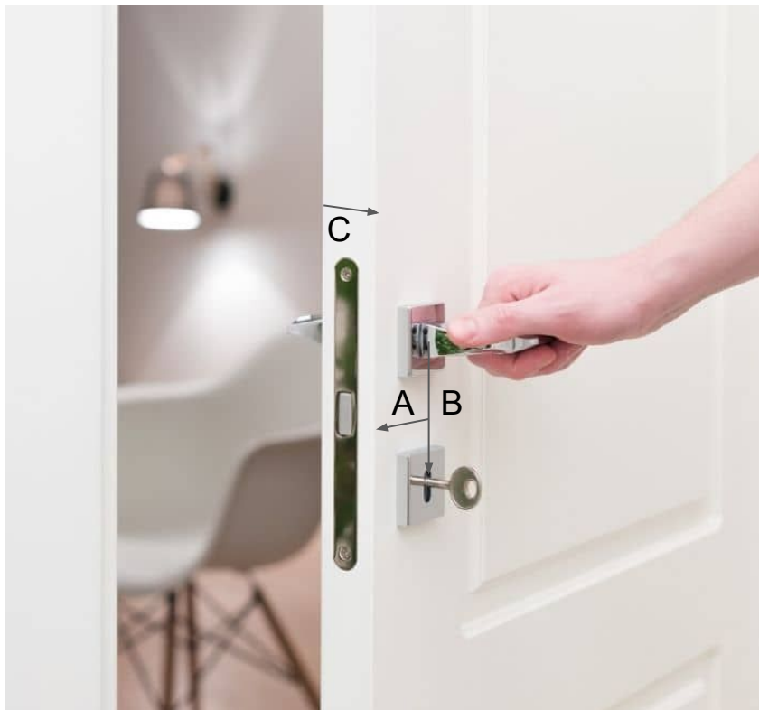
A - doremas (odległość od środka trzpienia do czoła drzwi) B - rozstaw C- grubość drzwi